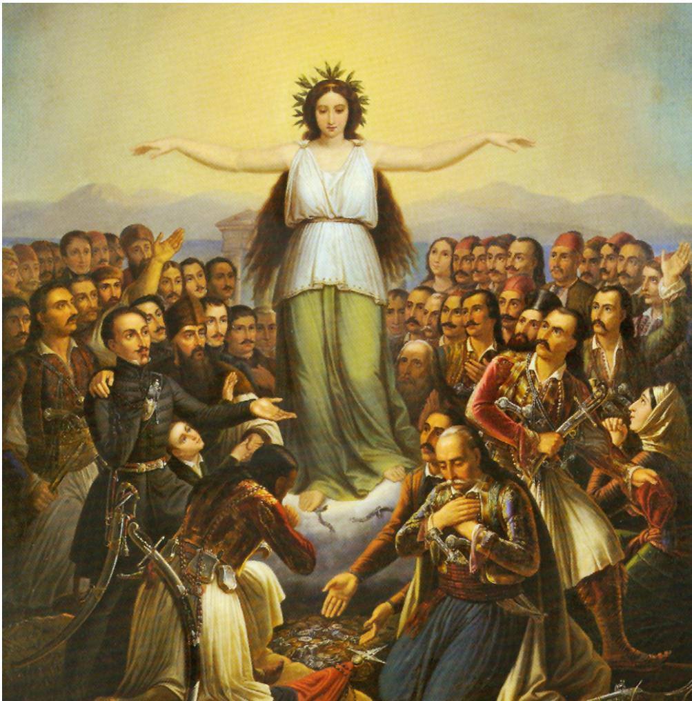
ΘΕΟΔΩΡΟΣ ΒΡΥΖΑΚΗΣ Η Ελλάς Ευγενωμούσα , 1858

21.00 Δείπνο σε παραδοσιακή ταβέρνα στον Προφήτη Ηλία