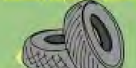
λάστιχο αυτοκινήτων 100 χρόνια