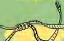
βαμβακερό σχονί 1-11 χρόνια