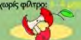
κοτσάνια μήλων 1 μήνα, 1 έτος ή 1 χρόνο