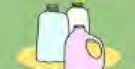
πλαστικά μπουκάλια 100 - 1200 χρόνια