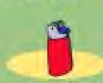
αναπτήρες 75 χρόνια