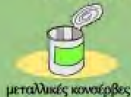
μεταλλικές κοναίρβες 10 - 100 χρόνια