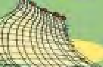
δίχτυα 100 χρόνια