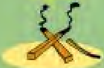
σιγάρα 1 ώρα