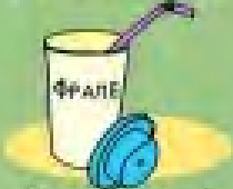
πλαστικό ποτήρι 50 χρόνια