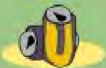
τενεκεδάκια αλουμινίου 100 - 200 χρόνια