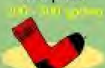
μάλλινο ρούχο 1 χρόνο