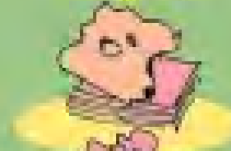
χαρτοπετσέτες 1 χρόνο