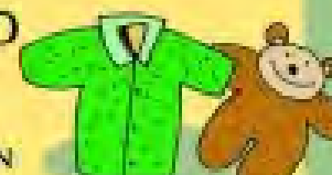
ΣΥΝΘΕΤΙΚΑ ΡΟΥΧΑ ΠΑΡΝΩΝΙΔΙΑ